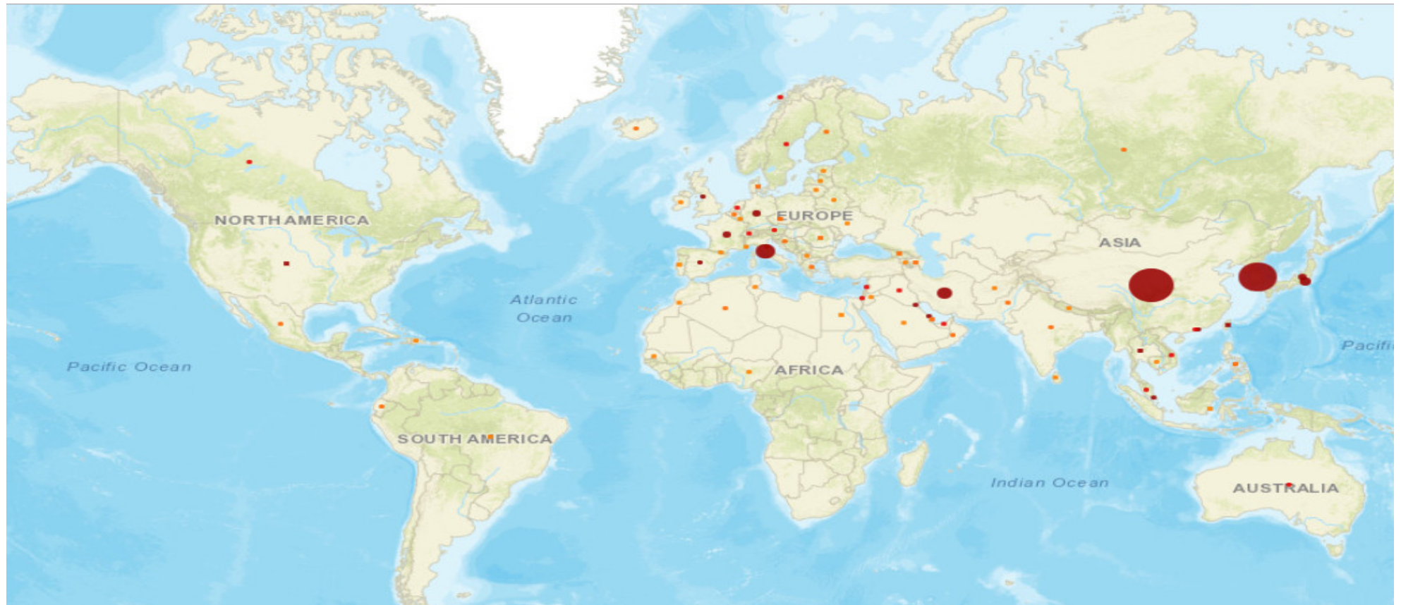
Figure n°1 : Distribution géographique mondiale des infections à COVID-19, à la date du 03 Mars 2020 15